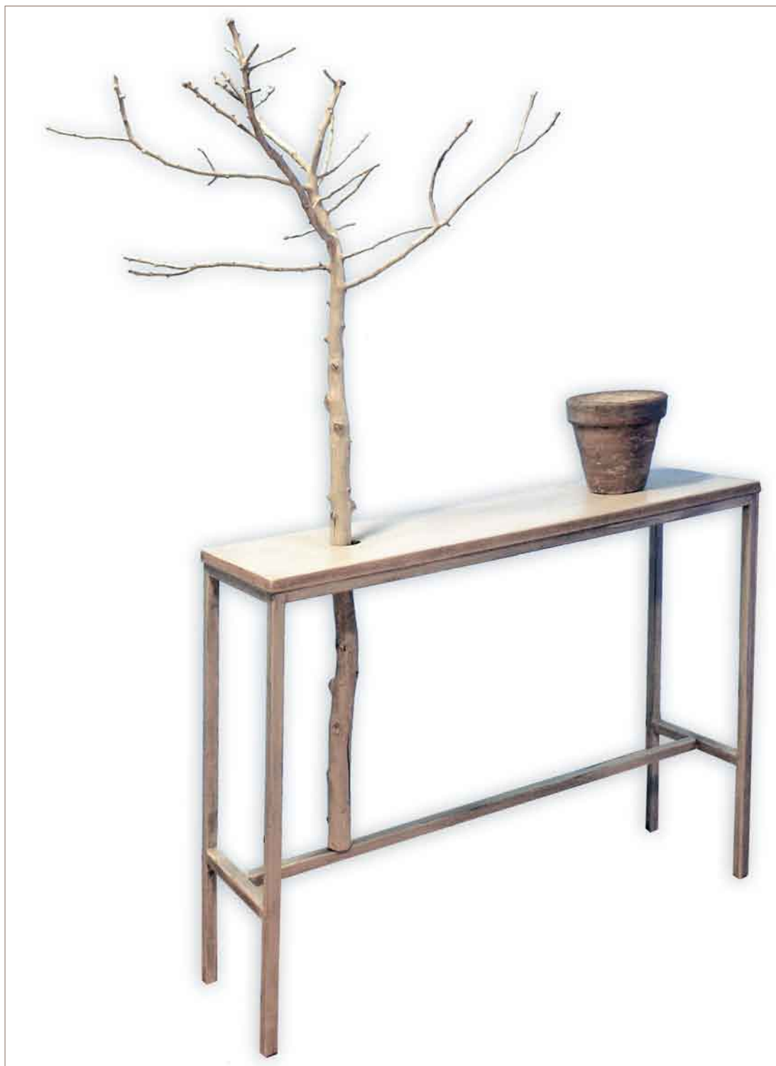
El bosque animado/ Daniel Gutiérrez. Técnica mixta. 220 x 116 x 90 cm