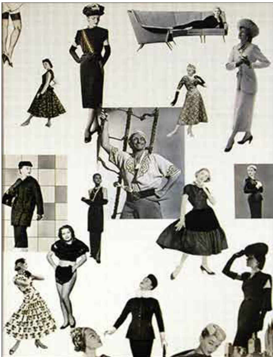
El rey de las mujeres / Dis Berlin. Fotografía, 97,5 x 70cm

Me gustan la cocina sin animales y los animales sin cocina. Las películas de amor con monstruos y de monstruos con amor. Leo y escribo por una misma causa: los buenos finales y los finales buenos.